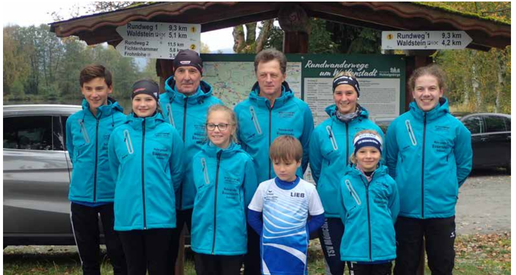
Unser letzter, gemeinsamer Wettkampf

Unsere kleinen, aber auch großen Kinder wurden zur Weihnachtszeit natürlich nicht vergessen und bekamen ein kleines Geschenk (Sprungseil) und eine neue Warnweste der Marke Craft.