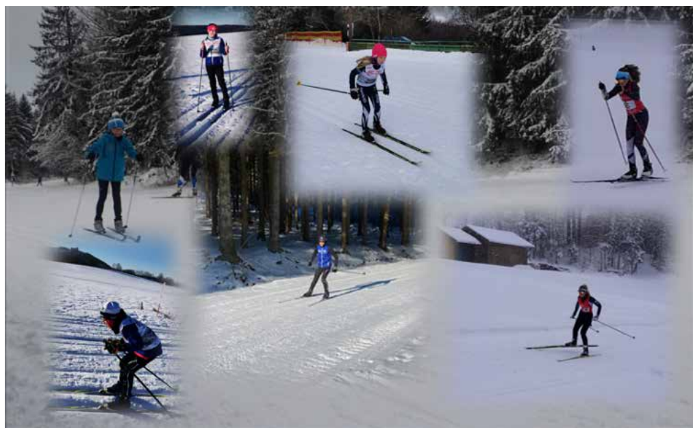
Unsere jungen Sportler in Aktion. Ein Gruppenbild war aufgrund der Hygienekonzepte nicht möglich

Die teils hervorragenden Schneebedingungen machten es möglich, dass - unter Einhaltung der Vorgaben - seit